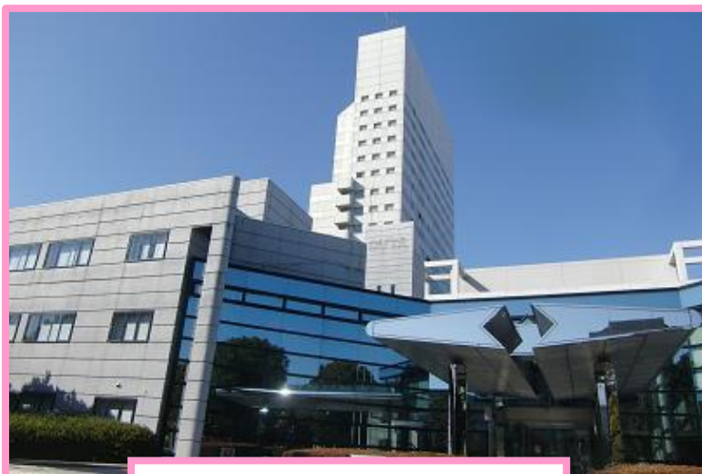
幕張国際研修センター

～平成25年10月6日（日曜日）～ 千葉県の実幕張にある幕張国際研修センターにて第21回OZAK学術集会が開催されました。この集会は年に1度グループ施設が集まり、現場のスタッフが実務を通して研究経験した内容を発表し、意見を交換し合うとても有意義な会です。